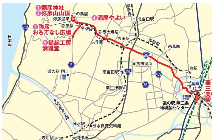
※運行の行程時間は目安となっております。また、ルートは当日の天候や交通状況等によって変更する場合があります。