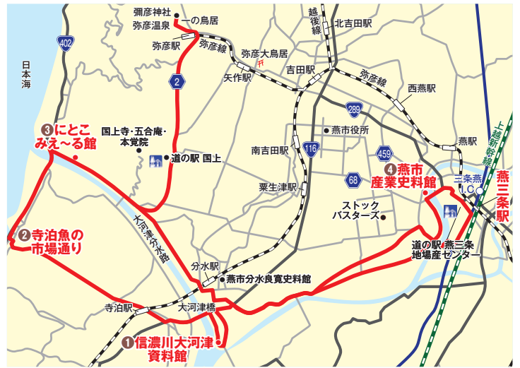
※運行の行程時間は目安となっております。また、ルートは当日の天候や交通状況等によって変更する場合があります。