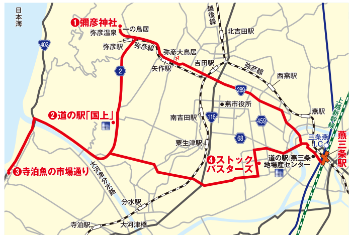
※ルートは当日の天候や交通状況等によって変更する場合があります。